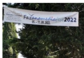
Al via il Fasana Media Fest