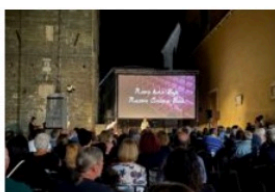
«Nuovo cinema Buie». La forza delle emozioni