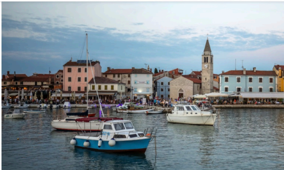
La Riva di Fasana.