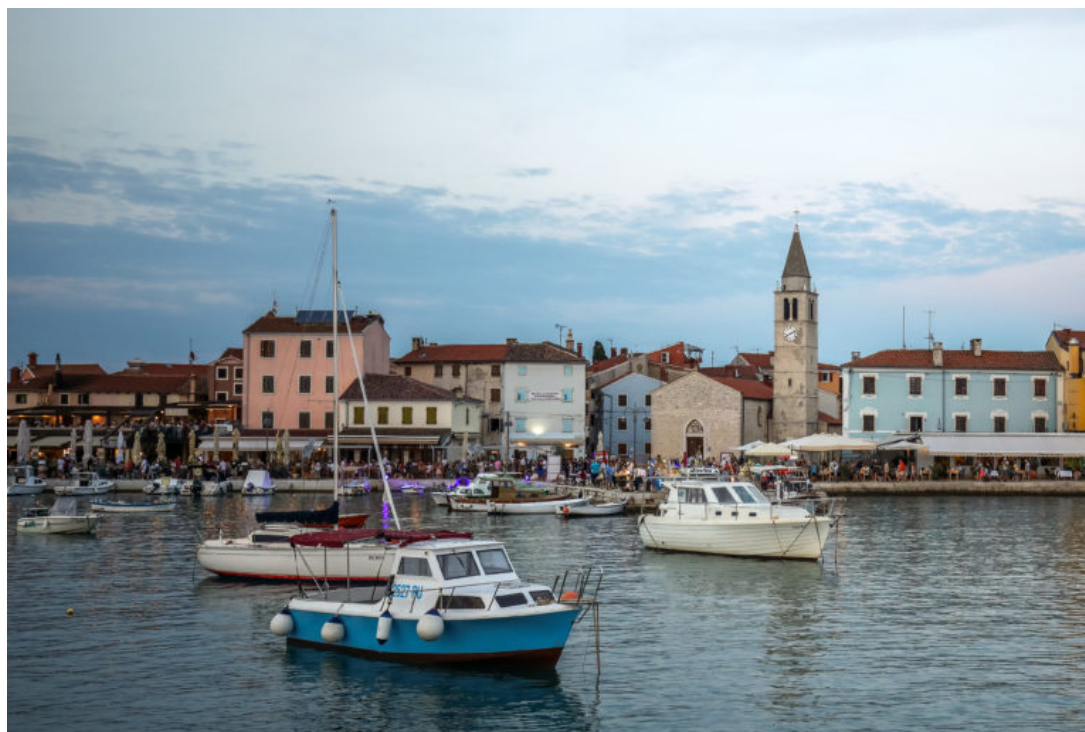
La Riva di Fasana.

Autore: Marko Mrđenović - Settembre 6, 2022