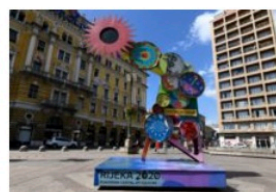
Contatore CEC: atto terzo. Sarà un cartello stradale