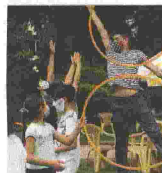
I GIOCHI all'aria aperta durante i centri estivi della Marca

IN CASO DI CONTAGI DA COVID L'USL HA PREDISPOSTO UN MODULO SPECIFICO PER EFFETTUARE LE SEGNALAZIONI